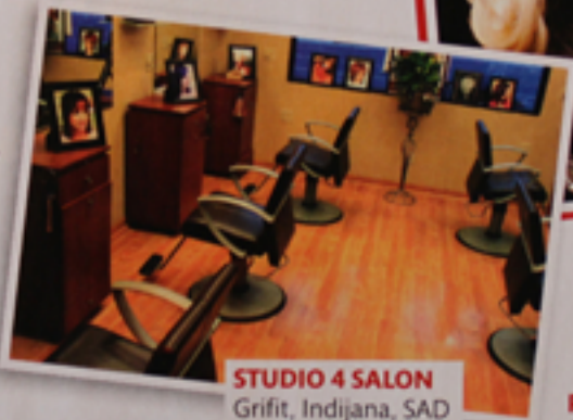
STUDIO 4 SALON Grifit, Indijana, SAD

Ovo su radovi njenih saradnica iz frizerskog salona, Džesi i Lize.