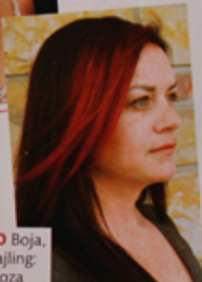
PLAMENO Boja, frizura i stajling: Lisa Mendoza